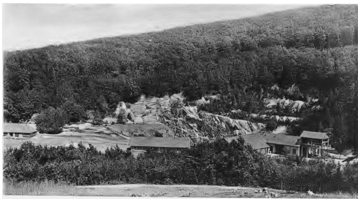
Máriavölgyi palabánya. - Mariathaler Schieferwerk. - Bridlicova baňa v Mariatál.